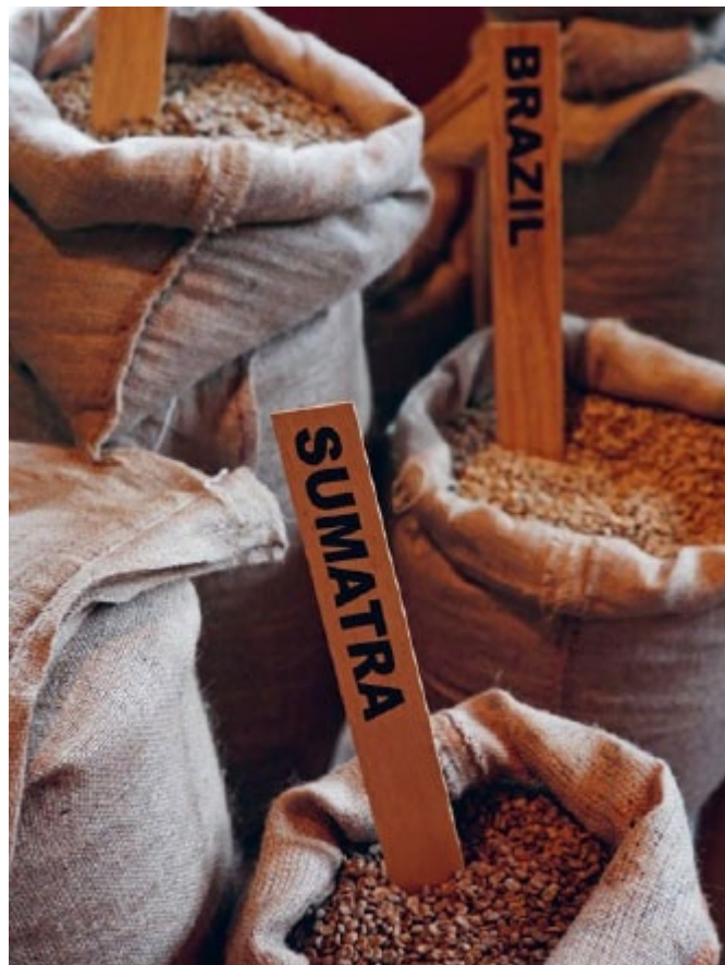
Кофе разного происхождения. Зелёные кофейные зёрна отправляются в обжарку.